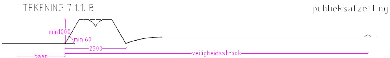
TEKENING 7.1.1. B

Dammen en wallen die langer dan 3 weken geen dienst doen moeten aan de baanzijde weer opnieuw opgezet worden met een minimale hoek van 70 graden.